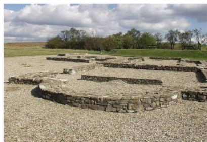
Sady u Uherského Hradiště, tzv. metropolitní vrch. Základy sakrálního komplexu, jenž je jedním z možných metropolitních chrámů Velké Moravy.