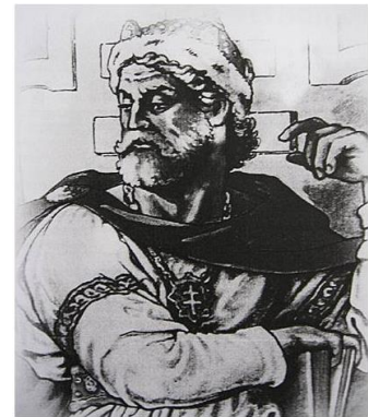
Jedna z fiktivních podob knížete Rastislava

Rastislav pocházel z vládnoucí dynastie Mojmirů. O rodinném postavení Rastislava panuje mnoho hypotéz. Nevylučuje se ani příbuzenství s nitranským knížetem Pribinou a přemyslovským Bořivojem. Faktem však zůstává, že věrohodně písemně potvrzený je jen vztah k prvnímu známému knížeti Moravy – Mojmiru I., jemuž byl Rastislav synovcem. O otcí a přímé linii této osobnosti bohužel nic určitého nevíme.