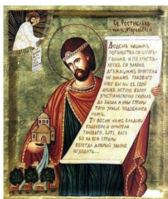
Ikona svatého Rastislava Moravského

Právě Rastislav položil základy k mocenskému vzestupu a učinil z Moravy neodmyslitelnou součást mapy Evropy. Díky jeho výzvě přišly na Moravu takové osobnosti jako Konstantin a Metoděj a s jeho podporou zde solunští bratři mohli uskutečnit své nesmrtelné dílo. I proto jej pravoslavná církev svatořečila a učinila z 28. října významný den Moravy. Rastislav je bezpochyby osobnost, která si v dějinách naší země zaslouží pozornost.