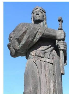
Slovákům knížete Pribinu připomíná socha v Nitře.

„nedobytné Rastislavovo město“ 4 . Ludvík Němec byl donucen k návratu. Moravané pak jeho ustupující vojsko napadali a způsobili mu nemalé ztráty 5 . Pokračovali dokonce i po překročení hraniční řeky Dunaje, kde plenili východofranské vesnice. Tím si Morava eliminovala ztráty způsobené přítomností franských vojsk. Po roce 861 Rastislav vojensky napadl knížete Pribinu 6 , porazil jej a připojil k Moravě některé části Panonského knížectví. Některá území pak sám udělil v léno Pribinovu synovi Kocelovi, jenž se stal jeho vazalem. Pribina v bitvě patrně zahynul. Ani na tento mocenský projev nemohl Ludvík Němec reagovat a nezbylo mu, než jen akceptovat rostoucí vliv Moravy.