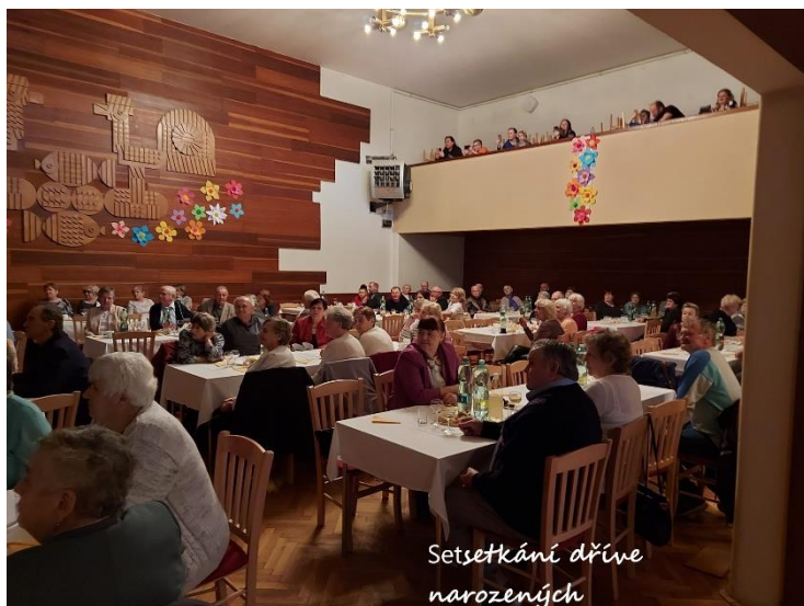
Setkání dříve narozených

opravdu originální. Tradiční kulturní a společenskou akcí je setkání seniorů. To bylo jako vždy úspěšné a myslím, že se všichni účastníci dobře pobavili. Poslední kulturní akcí, která proběhla před uzávěrkou tohoto vydání, byly hody v Plinkoutě. Všem organizátorům uvedených akcí velmi děkuji. Zaslouží si uznání všech občanů. Dělat něco pro druhé ve svém vlastním volnu a bez nároku na honorář je věc záslužná a mnohdy nedocenená.